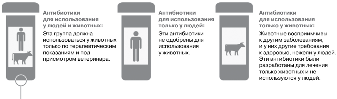
Рис. 4. Три группы антибиотиков согласно классификации FDA.

Антибиотики, в зависимости от возможности использования, могут быть разделены на три группы: