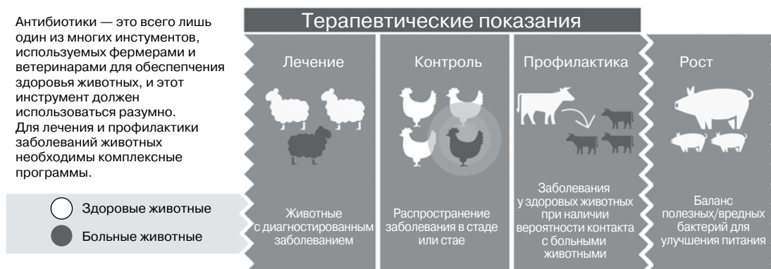
Рис. 1. Варианты использования антибиотиков в ветеринарии.